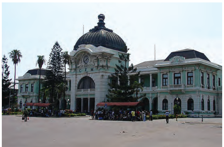
Maputo Hauptbahnhof