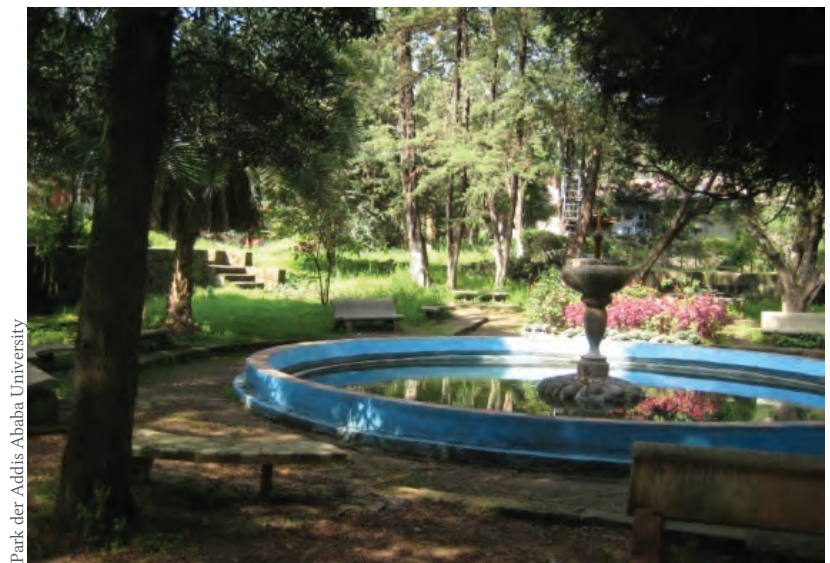
Park der Addis Ababa University