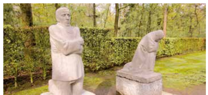
Käthe Kollwitz' „Trauernde Eltern“ auf dem deutschen Soldatenfriedhof Vladslo, Belgien.